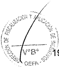
Fuente: Página 11 del archivo PDF denominado "Informe N° 787-2015-OEFA/DS-HID" contenido en el CD obrante en el Expediente.