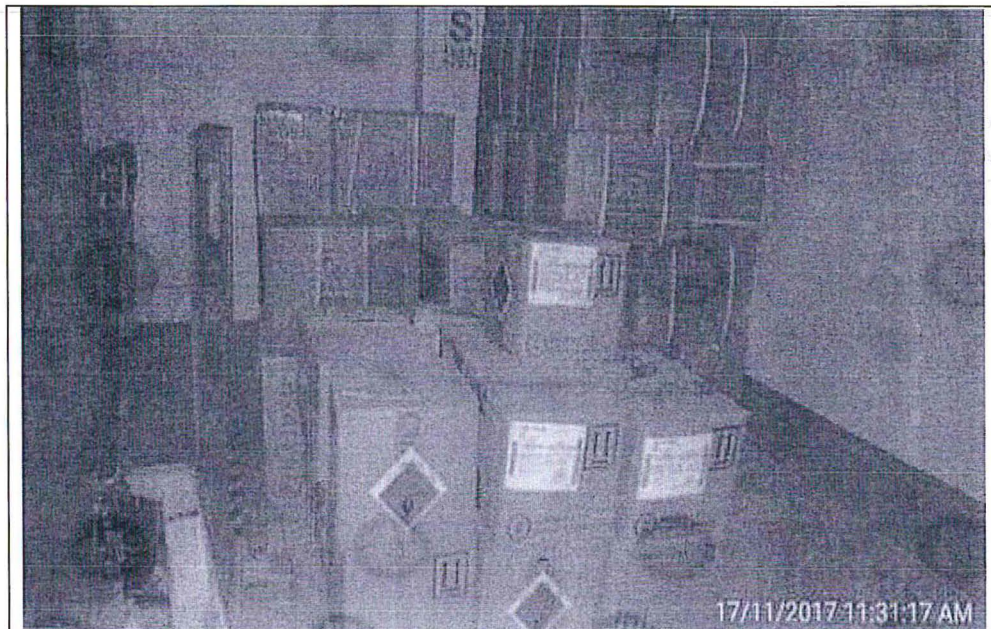
Fotografía tomada durante la Supervisión Especial 2017, en la que se observa cajas con insumos y materia prima dentro de la zona de almacén de materia prima.