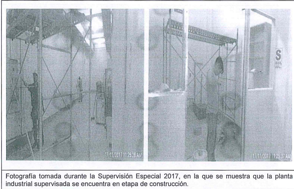
Fotografía tomada durante la Supervisión Especial 2017, en la que se muestra que la planta industrial supervisada se encuentra en etapa de construcción.

administrado se encontraba desarrollando actividades correspondientes a la etapa de construcción de la planta industrial (instalaciones de agua y desagüe, instalaciones eléctricas, obras civiles y montaje de extractores de aire); asimismo se observó que almacena insumos y materia prima para su actividad productiva; sin contar con el instrumento de gestión ambiental aprobado por el sector competente, tal como se muestra en las siguientes fotografías 12 :