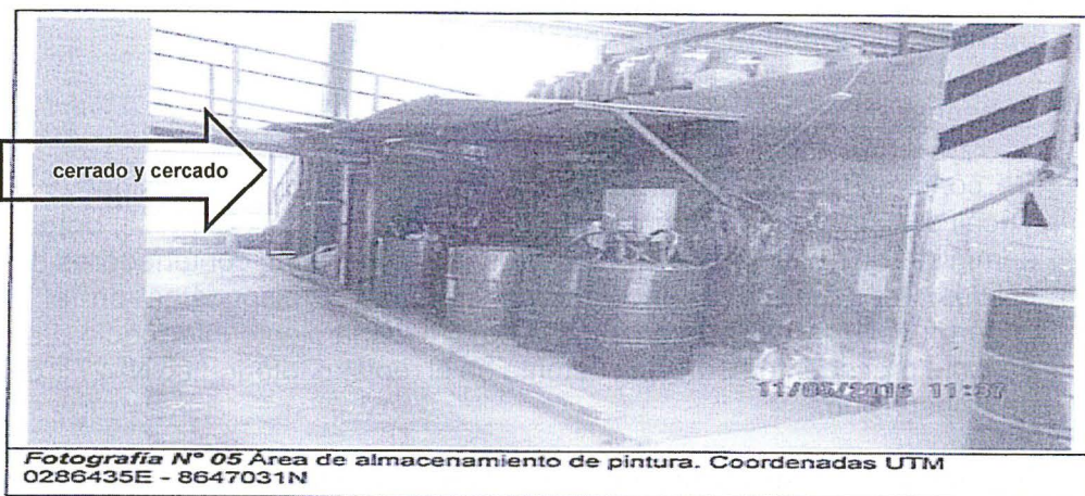
Fotografía N° 05 Área de almacenamiento de pintura. Coordenadas UTM 0286435E - 8647031N