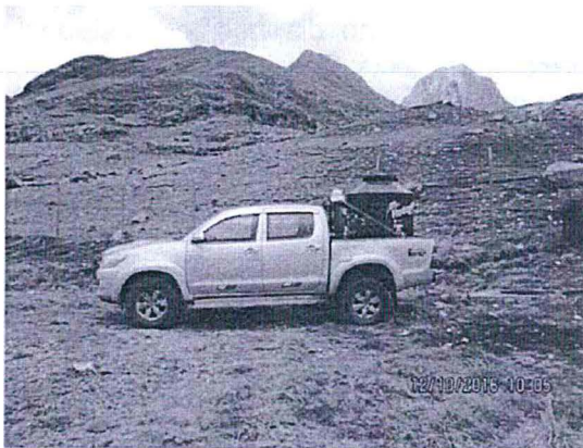
FOTO 1. Los residuos fueron trasladados hacia la trinchera sanitaria, en la imagen se aprecia que el contenedor fue colocado en la tolva de la camioneta.