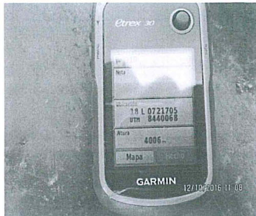
FOTO 6. Coordenadas UTM tomadas en el Sistema WGS84, ubicada exactamente en el interior de la trinchera sanitaria.