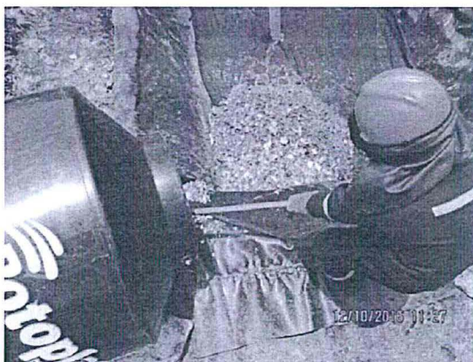
FOTO 3. Se muestra el momento en el cual los residuos sólidos son depositados en el interior de la trinchera sanitaria, nótese que la superficie se encuentra impermeabilizada con geomembrana de baja densidad.