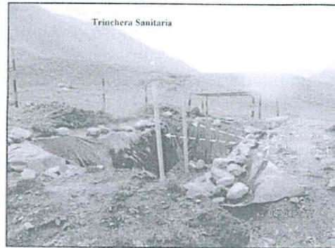
Fotografía N° 43: Vista fotografica de la Trinchera Sanitaria, es el area destinada para la disposición final de los residuos orgánicos provenientes del comedor y demás puntos de acopio, consta de un compartimiento donde se disponen los residuos, dicha area se encontraba conformado por dos chimeneas e impermeabilizado con geomembrana. Además se observo otro compartimento para los lixiviados que se encontraba cubierto con techo de calamina y el perimetro del area contaba con un cerco metálico.