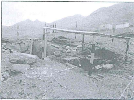
Fotografía N° 44: Otra vista fotografica de la Trinchera Sanitaria, donde se puede observar el compartimento para los lixiviados el cual se encuentra techo de calamina; asimismo contaba con un cerco perimétrico metálico, ubicada en las coordenadas UTM WGS 84: 8440081 N, 721703 E y con altitud 4283 msnm.