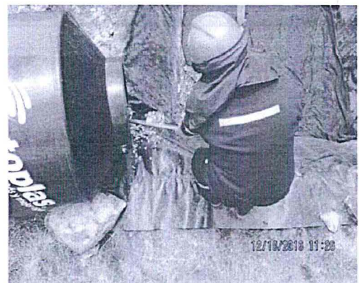
FOTO 4. Momento en el cual los residuos sólidos domésticos observados son dispuestos en el interior de la trinchera sanitaria.