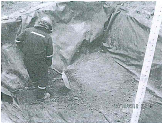
FOTO 5. Luego de colocar el residuo orgánico se procedió con colocar una capa de suelo orgánico de 0.15 cm de espeso conforme lo establece el instrumento de gestión ambiental.