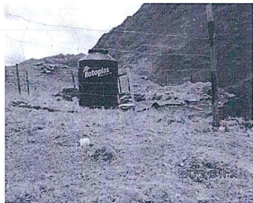
FOTO 2. Vista panorámica de la ubicación de la trinchera sanitaria, apreciándose como cerco una malla metálica.