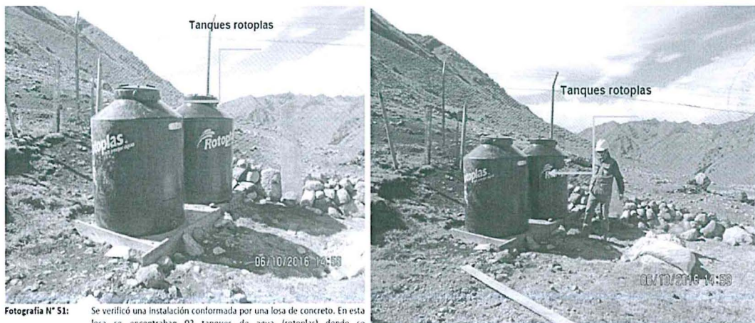
Fotografía N° 51: Se verificó una instalación conformada por una losa de concreto. En esta losa se encontraban 02 tanques de agua (rotoplas) donde se almacenaban los residuos orgánicos provenientes del campamento base Tumipampa.