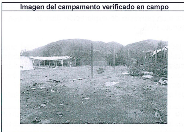
Imagen del campamento verificado en campo