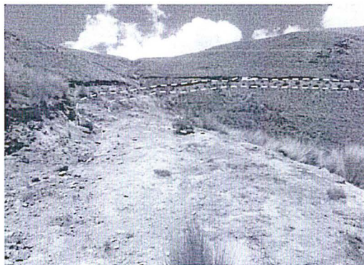
Imagen del acceso ubicado en las coordenadas WGS 84: N 8 436 269 E 186 701