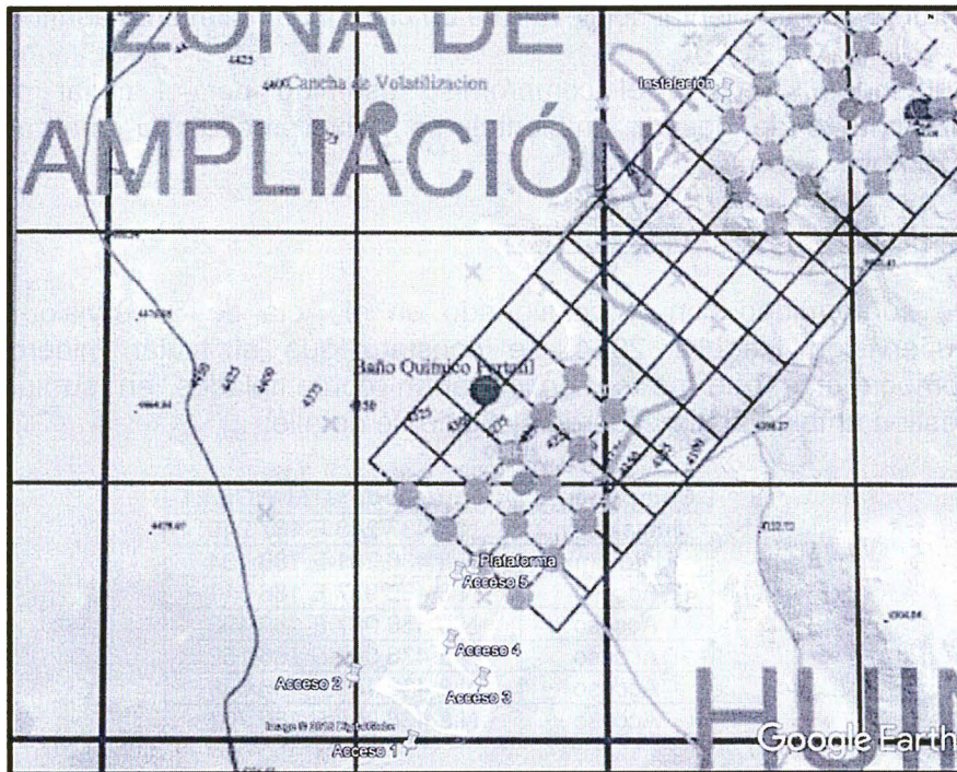
Elaborado por la Dirección de Fiscalización y Aplicación de Incentivos.