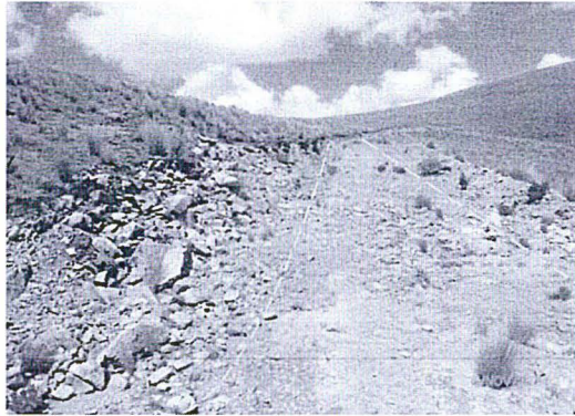
Imagen del acceso ubicado en las coordenadas WGS 84: N 8 436 062 E 186 752