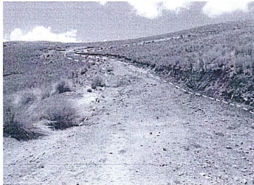
Imagen del acceso ubicado en las coordenadas WGS 84: N 8 436 135 E 186 688