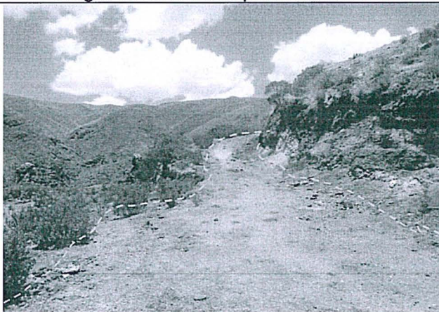
Imagen del acceso a la plataforma ODH-09