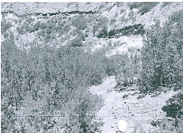
Imagen del acceso a la plataforma ODH-12