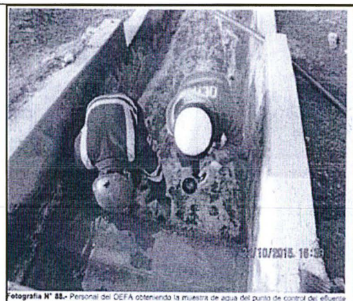
Fotografía N° 88.- Personal del OEFA obteniendo la muestra de agua del punto de control del efluente EF-08. Efluente final de la salida del sistema de tratamiento de aguas provenientes de interior mina en el nivel P (planta de neutralización).