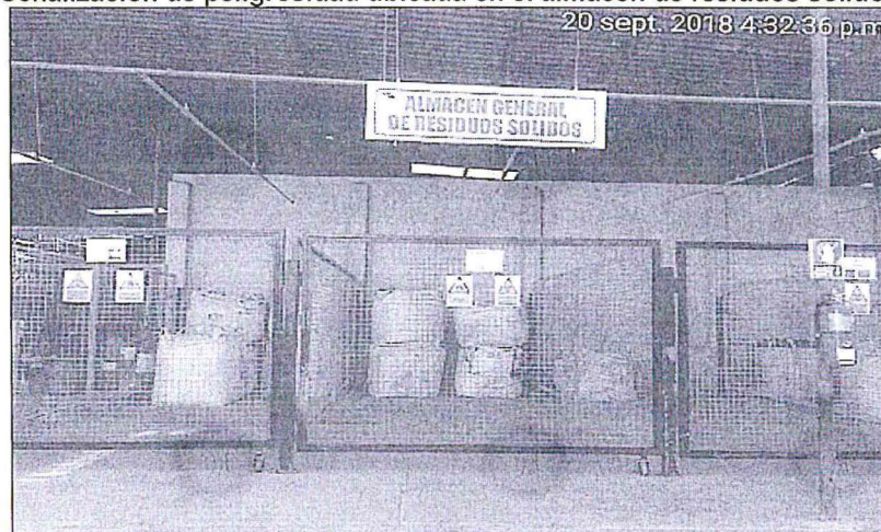
Señalización de peligrosidad ubicada en el almacén de residuos sólidos