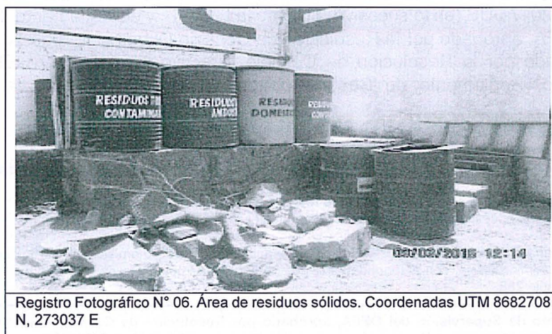
Registro Fotográfico N° 06. Área de residuos sólidos. Coordenadas UTM 8682708 N, 273037 E