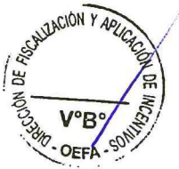
Fuente: Informe de Supervisión.