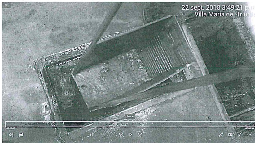
Imagen N° 2: Rejilla implementada en la caja de registro.