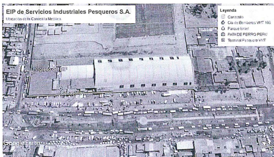
Imagen N° 4: Verificación de las coordenadas UTM. Elaboración: Dirección de Fiscalización y Aplicación de Incentivos