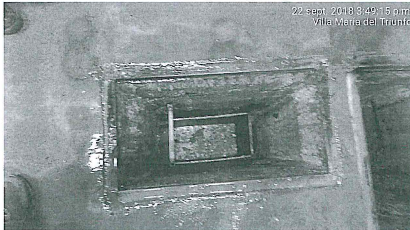
Imagen N° 1: Ubicación de la caja de registro.