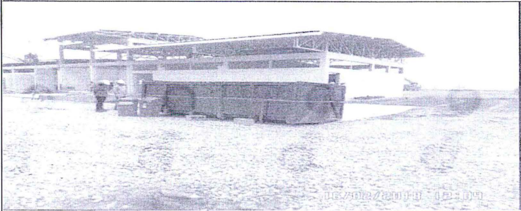
Foto N°05: Vista fotográfica del interior de la "Caja Ecológica"; durante la supervisión se observó que dentro de dicha caja ecológica habían tanto residuos sólidos peligrosos como los que se muestran en las fotos B, C y D. que corresponden a envases vacíos de thinner, trapos manchados con aceites o hidrocarburos, envase de pegamento para PVC, entre otros; así como residuos no peligrosos, como los que se ven en la toma A: cartones, plásticos, envases vacíos de agua emvasada, entre otros.

Foto N°04: Vista fotográfica al interior de la Unidad Fiscalizable, se aprecia la existencia de un contenedor metálico el cual es utilizado por el administrado como zona de acopio de residuos sólidos peligrosos y no peligrosos, esta caja es denominada por el administrado como "Caja Ecológica".