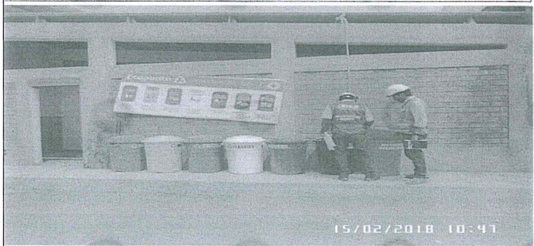
Foto N°03: Vista fotográfica de uno de los "Eco puntos", se observa la instalación de tachos de colores para la disposición de residuos sólidos peligrosos y no peligrosos según sus características físicas, químicas y biológicas, así como la peligrosidad de los mismos.