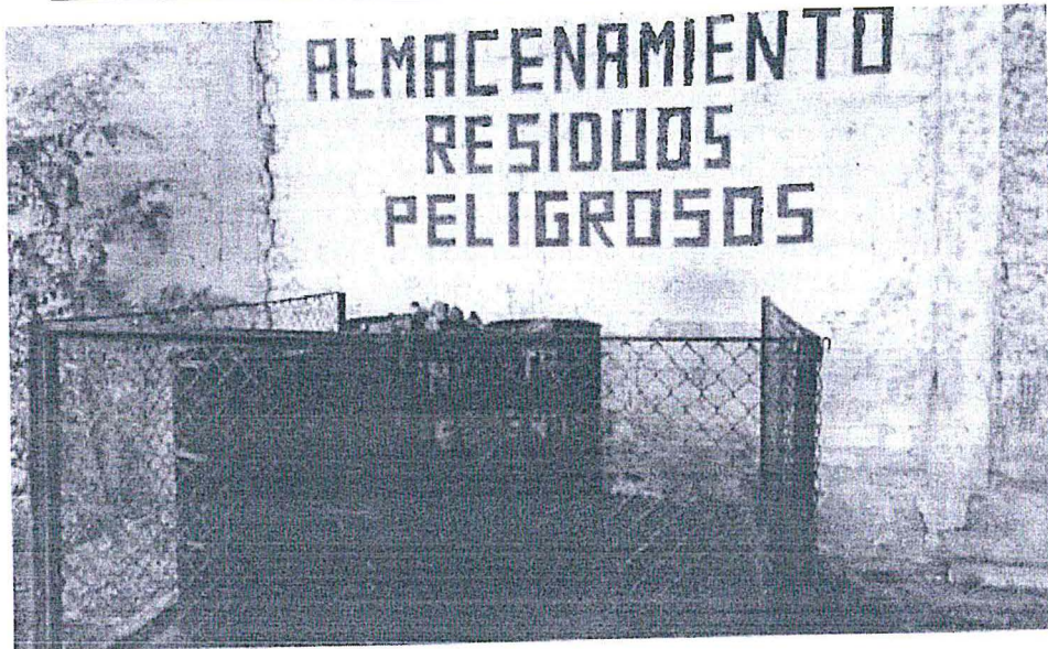
IMAGEN N° 2: Vistas fotográficas - Anexo del recurso de reconsideración