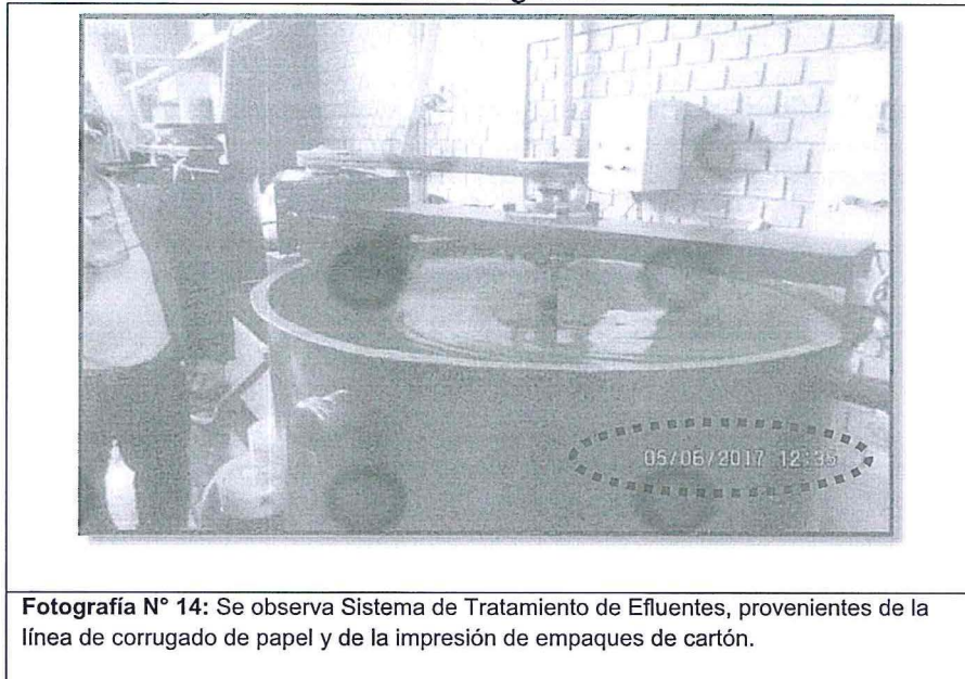
Fotografía N° 14: Se observa Sistema de Tratamiento de Efluentes, provenientes de la línea de corrugado de papel y de la impresión de empaques de cartón.