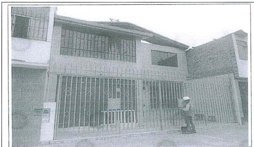
Fotografía N° 2: Vista panorámica del personal de OEFA realizando la supervisión programada el 6 de abril de 2017 al inmueble del administrado.