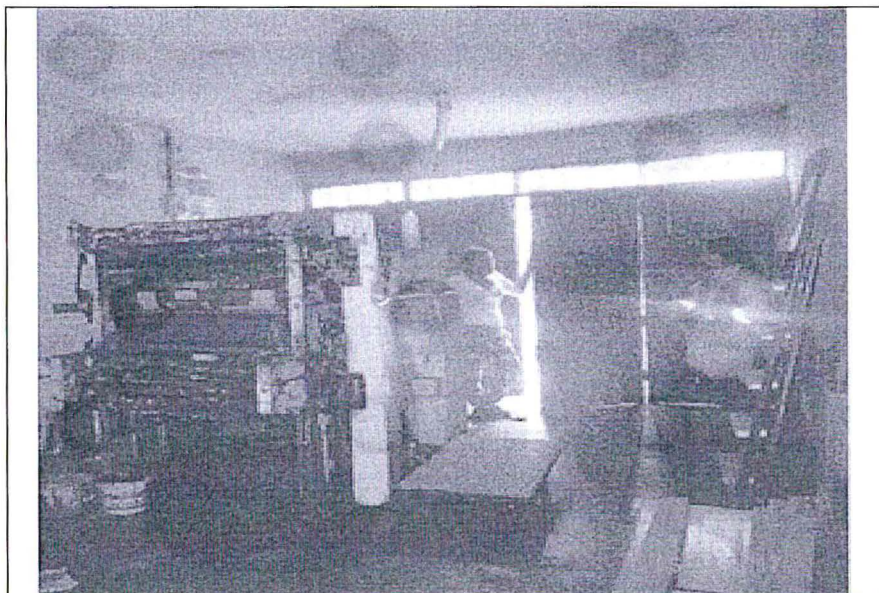
Fotografía N° 3: Vista panorámica del interior de la cochera ubicada en el primer piso, observándose una maquina impresora en desuso y baldes vacíos de tintas.