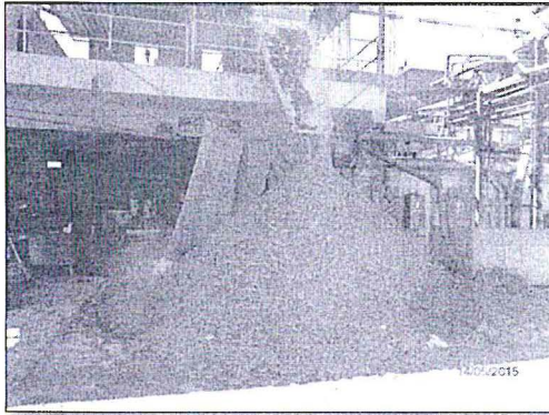
Fotografía N° 2: Se observa lodos residuales provenientes de la prensa del sistema de tratamiento de efluentes.