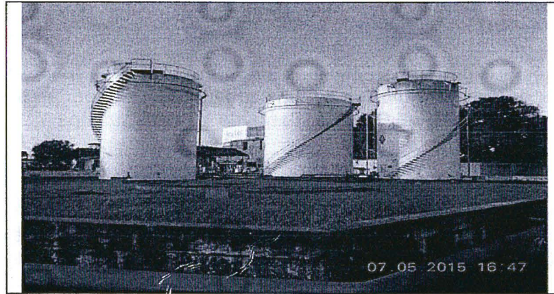
Foto N° 16: Vista del patio de tanques; cuenta con tres (03) tanques verticales de combustibles tales como: Gasolina 84, Gasolina 90 y Diésel B5. El área estanca se encuentra rodeada por un muro de contención, presenta sistema de drenaje para aguas pluviales y no se encuentra impermeabilizada.