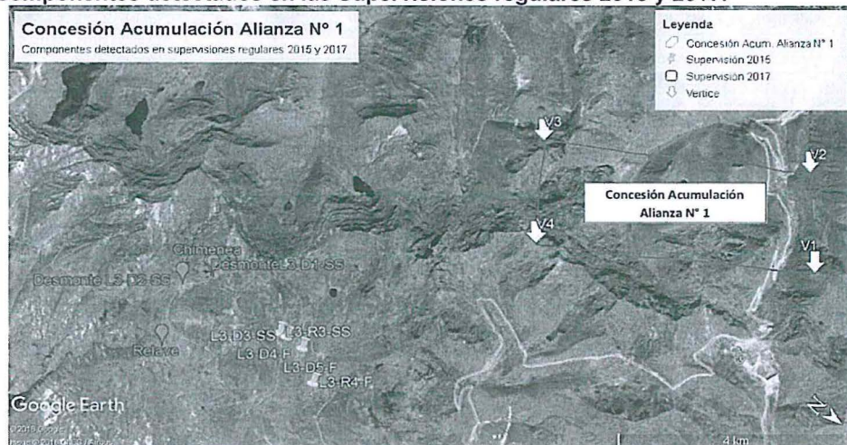
Imagen 2: Ubicación de la concesión Alianza N.º 1 respecto de la ubicación de los componentes detectados en las Supervisiones regulares 2015 y 2017.