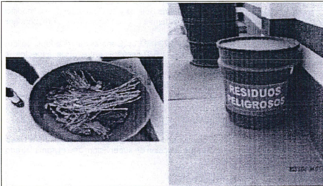
Fotografía N° 9: Vista del almacenamiento de residuos peligrosos donde se dispuso residuos no peligrosos.