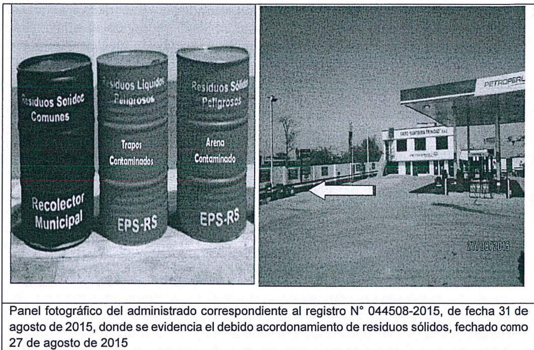
Panel fotográfico del administrado correspondiente al registro N° 044508-2015, de fecha 31 de agosto de 2015, donde se evidencia el debido acordonamiento de residuos sólidos, fechado como 27 de agosto de 2015

mejor control de los residuos peligrosos y no peligrosos generados en la unidad fiscalizable