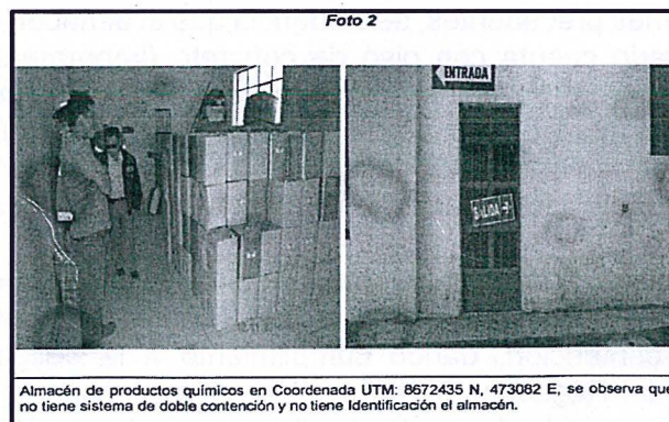
Fotografía N° 2 del Informe de Supervisión 12