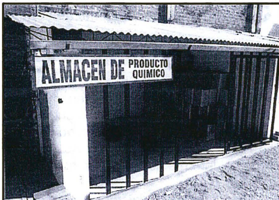
Fotografía N° 3 del escrito presentado el 30 de octubre del 2015