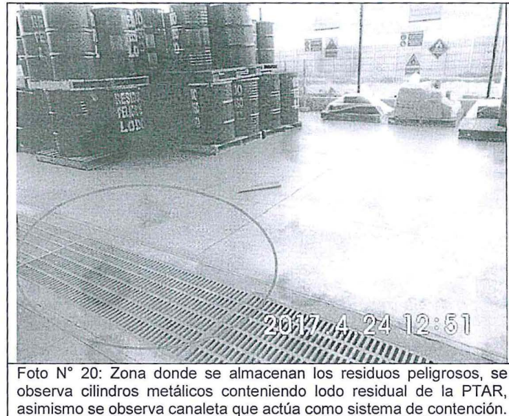
Foto N° 20: Zona donde se almacenan los residuos peligrosos, se observa cilindros metálicos conteniendo lodo residual de la PTAR, asimismo se observa canaleta que actúa como sistema de contención.