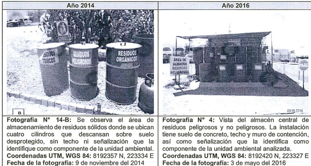
Cuadro N° 1: Área de almacenamiento de residuos sólidos peligrosos y no peligrosos

Fuentes: Página 28 del Informe de Supervisión N° 815-2014-OEFA/DS-HID y página 49 del Informe de Supervisión Complementario N° 602-2017-OEFA/DS-HID