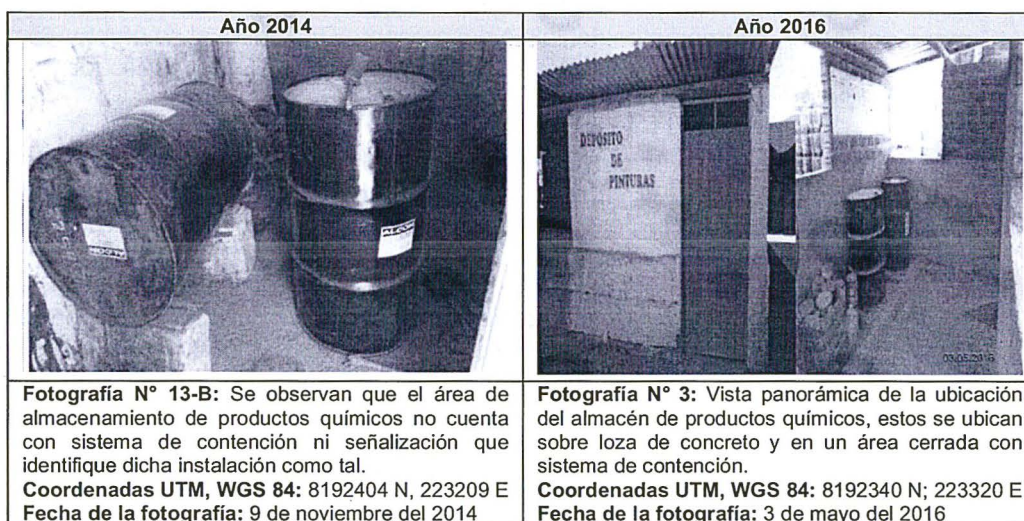
Cuadro N° 3: Adecuado almacenamiento de productos químicos

Fuentes: Página 28 del Informe de Supervisión N° 815-2014-OEFA/DS-HID y página 49 del Informe de Supervisión Complementario N° 602-2017-OEFA/DS-HID