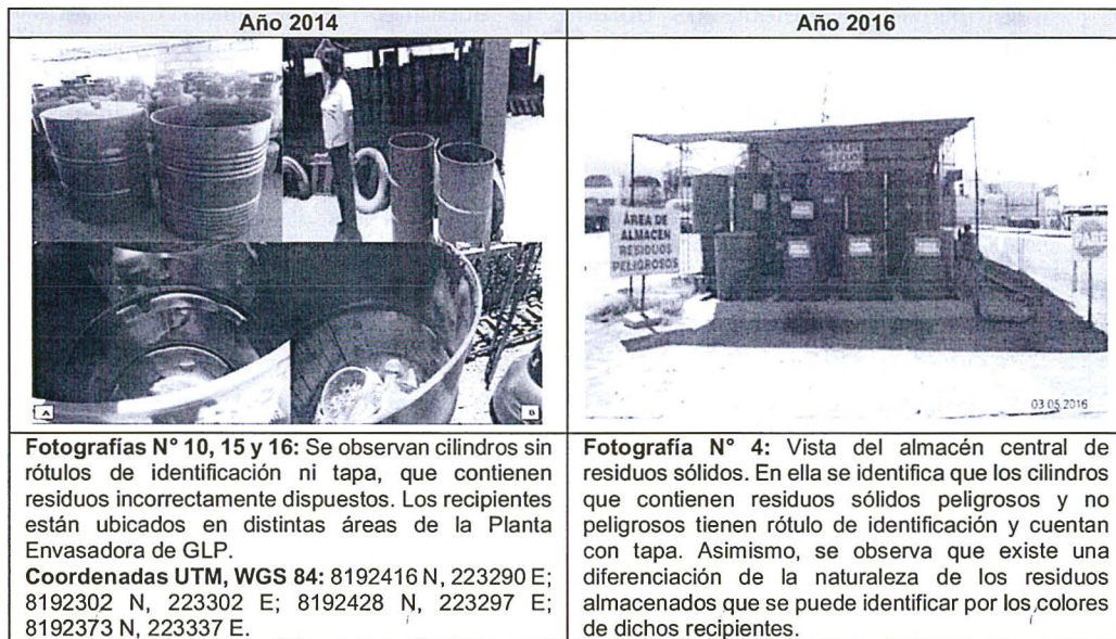
Cuadro N° 2: Adecuado acondicionamiento y almacenamiento de residuos sólidos

12. De la revisión del Informe de Supervisión Complementario, se verificó 17 que los residuos sólidos peligrosos y no peligrosos generados en la Planta Envasadora de GLP son dispuestos de acuerdo a su naturaleza y están contenidos en recipientes tapados que cuentan con rótulo de identificación, ubicados en el área destinada para dicho fin; es decir, su adecuado acondicionamiento y almacenamiento. En consecuencia, el administrado dio cumplimiento a la obligación establecida en la normativa correspondiente. A continuación, se presenta un cuadro que evidencia lo expuesto: