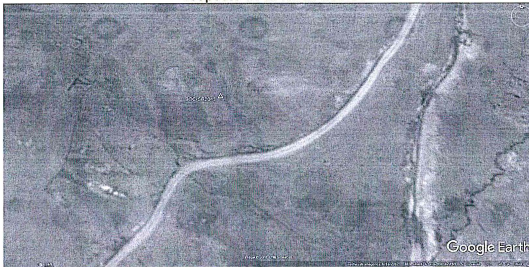
Imagen 4: Ubicación de la bocamina detectada en la Supervisión Especial 2017 respecto de la vía de acceso

32. Del aplicativo Google Earth, se aprecia que la bocamina no cuenta con acceso de llegada; por tanto, de haber estado incluido en la MPCPAM Santa Bárbara, las medidas de cierre aprobadas hubiesen sido similares a las ejecutadas. La imagen de Google Earth se muestran a continuación: