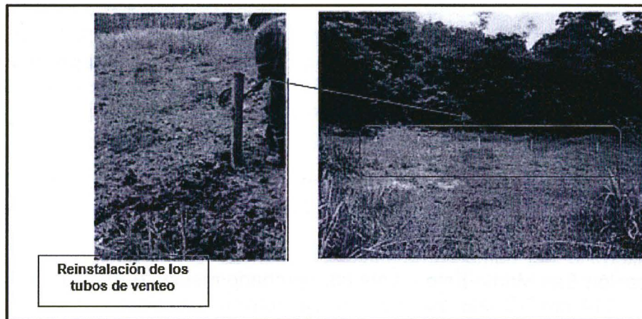
Gráfico N°1: Reinstalación de los tubos de venteo