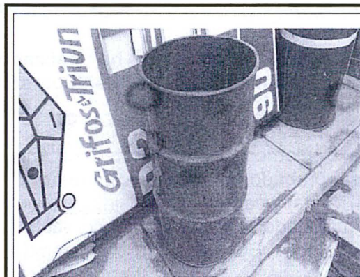
Fotografía 6. Vista del contenedor de color verde sin rotulación conteniendo residuos líquidos peligrosos (aceite usado), encontrado en el grifo "El Triunfo", operado por la empresa GRIFOS EL TRIUNFO E.I.R.L., ubicado en la Av. Ricardo Palma Amaru N° 620, distrito de Bambamarca, provincia de Hualgayoc del departamento de Cajamarca.