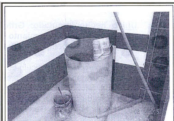
Fotografía 8. Vista del contenedor de color amarillo sin rotulación conteniendo residuos líquidos peligrosos (aceite usado), encontrado en el grifo "El Triunfo", operado por la empresa GRIFOS EL TRIUNFO E.I.R.L., ubicado en la Av. Ricardo Palma Amaru N° 620, distrito de Bambamarca, provincia de Hualgayoc del departamento de Cajamarca.