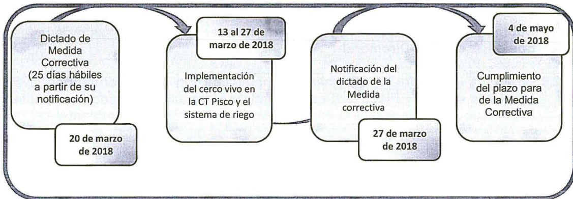
Tabla N° 2 Línea de Tiempo