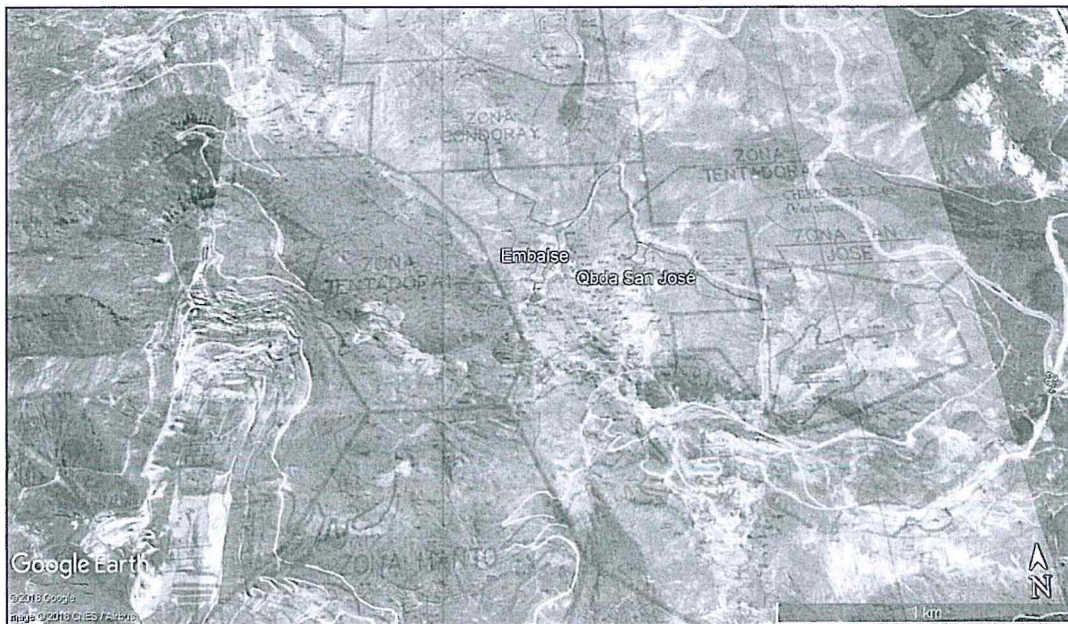
Imagen de superposición: Plano N°4, V Modificación del Plan de Cierre de Minas de la UM Julcani. Aprobado por RD N° 114-2017-MEM-DGAAM, sustentada en el Informe N° 171-2017-MEM-DGAAM/DNAM/DGAM/PC.