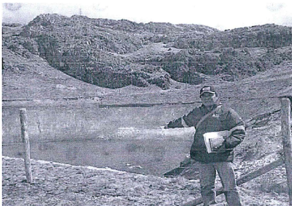
Embalse natural sin nombre solicitado para autorización de uso de agua por la Unidad de Producción Julcani de la Cia. De Minas Buenaventura S.A.A. para el proyecto de exploración minera Taype Galindo, Octubre del 2015.