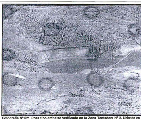
Fotografía N° 52: Poza tipo embalse verificado en la Zona Tentadora N° 2. Ubicado en las Coordenadas UTM WGS84 8569182 N - 522385 E. Hallazgo de Gabinete N° 4.