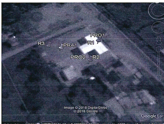
Tabla N° 1: puntos monitoreados en el Informe de Monitoreo Ambiental 2017-IV