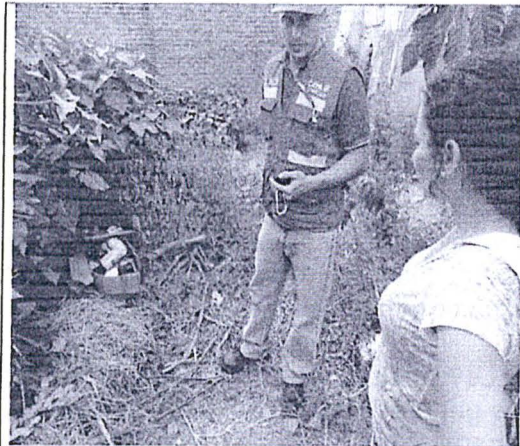
Registro Fotográfico N°04. Vista de filtros de aceite de camión usados almacenados como desecho en terrenos abiertos al lado del establecimiento