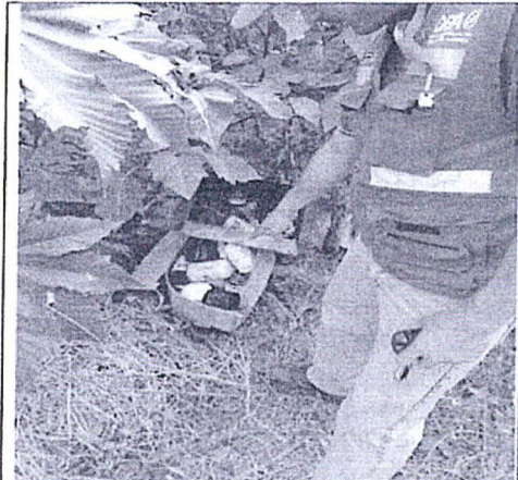
Registro Fotográfico N°05. Vista de filtros de aceite de camión usados almacenados como desecho en terrenos abiertos al lado del establecimiento