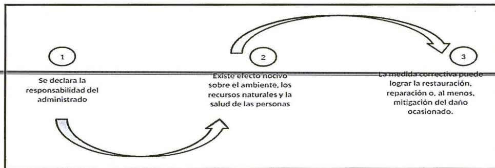
Gráfico N° 1: Secuencia de análisis para la emisión de una medida correctiva cuando existe efecto nocivo o este continúa

Elaboración: Dirección de Fiscalización y Aplicación de Incentivos del OEFA