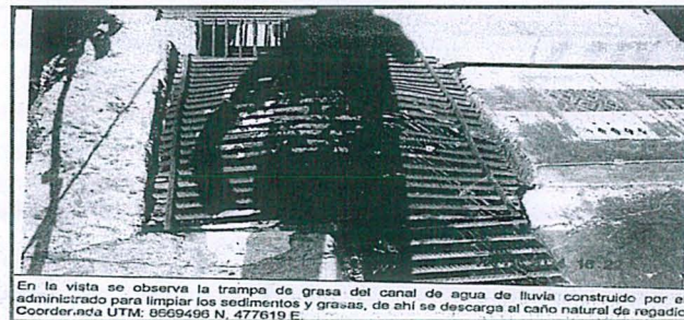
En la vista se observa la trampa de grasa del canal de agua de lluvia construido por el administrado para limpiar los sedimentos y grasas, de ahí se descarga al caño natural de regadío Coordinadora UTRV 0209-490 N. 477619 E.