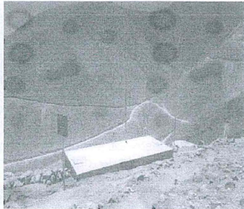
Fotografía N°5: Re-direccionamiento de la línea principal del ARD al pozo séptico N°3 para captación y actual funcionamiento.