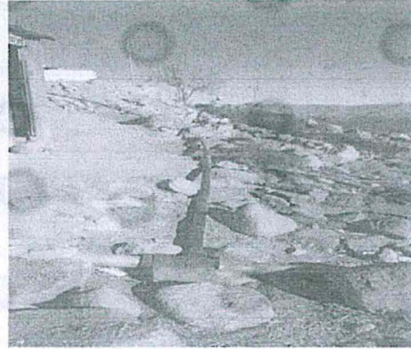
Fotografía N°4: Implementación de cajas de registro y conexiones a la línea principal del ARD.