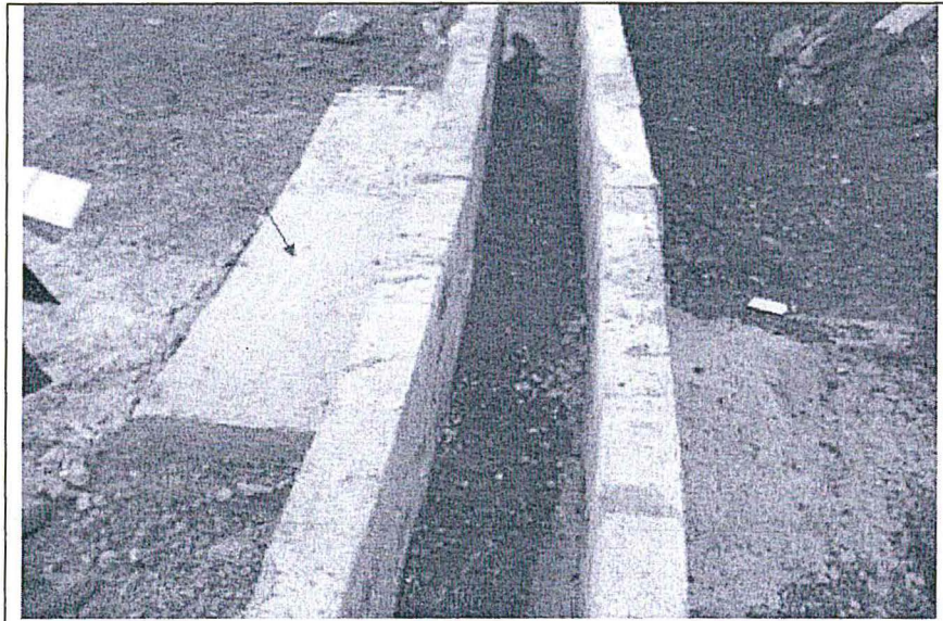
Fotografía N° 28. Chimenea 4460.- Ubicado en las coordenadas Datum WGS84, Zona 18: 313636E, 8833341N, Cota: 4512. Se aprecia la losa de concreto que sella a esta chimenea.