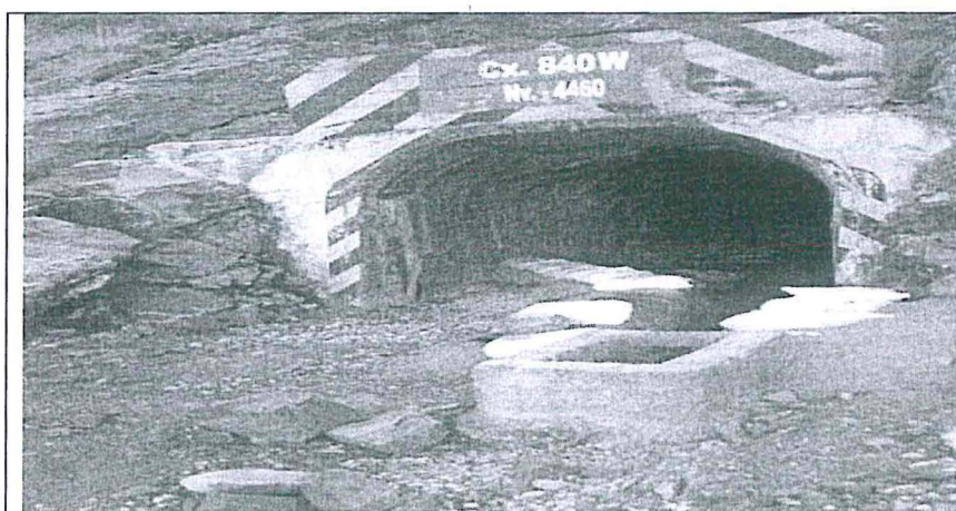
Fotografía N° 7. Bocamina 4460 – Nivel Principal – Pozo Rico.- Ubicado en las coordenadas Datum WGS84, Zona 18: 313634E, 8833361N, Cota: 4513. Se aprecia la bocamina señalada como Niv. 4460 CX 840 W y un canal revestido con geomembrana el cual empalma a una tubería HDPE de 4 pulg que deriva el drenaje a la CH-4460