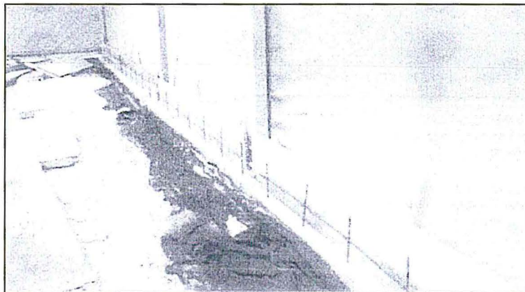
Registro Fotográfico N° 5: Encofrado del muro para contención