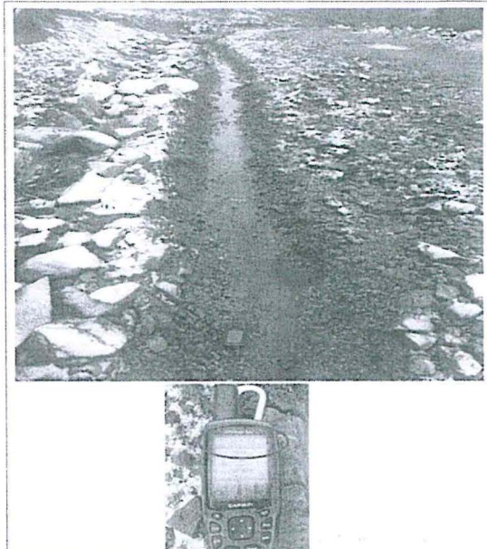
Vista panorámica de accesos hacia las áreas de extracción de mineral, evidenciando las cunetas de derivación de agua de escorrentía. El GPS nos muestra las siguientes coordenadas: E 369550 N 8716193