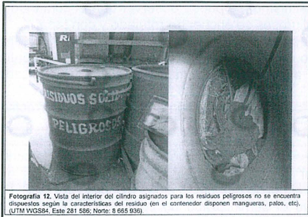
Fotografía 12. Vista del interior del cilindro asignados para los residuos peligrosos no se encuentra dispuestos según la características del residuo (en el contenedor disponen mangueras, palos, etc). (UTM WGS84, Este 281 586; Norte: 8 665 936).