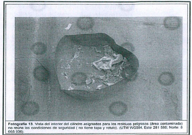
Fotografía 13. Vista del interior del cilindro asignados para los residuos peligrosos (área contaminada) no reúne las condiciones de seguridad (no tiene tapa y rotulo). (UTM WGS84, Este 281 586; Norte: 8 665 936).

16. En el ITA 15 , la Dirección de Supervisión concluyó que el administrado no habría realizado un adecuado acondicionamiento de los residuos sólidos peligrosos que genera su establecimiento.