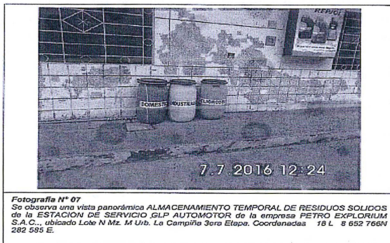
Imagen N° 1. Vistas fotográficas de acondicionamiento de residuos sólidos peligrosos