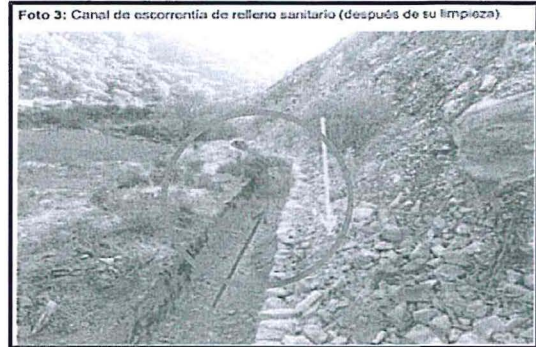
Fotografía presentada por el administrado el 5 de enero 2017