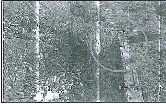
Fotografía tomada en la Supervisión Regular 2016