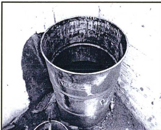
Imagen 1: Almacenamiento de los residuos sólidos peligrosos