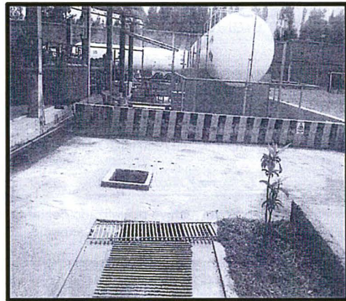
Fuente: Escrito de descargos del administrado del 11 de mayo del 2018