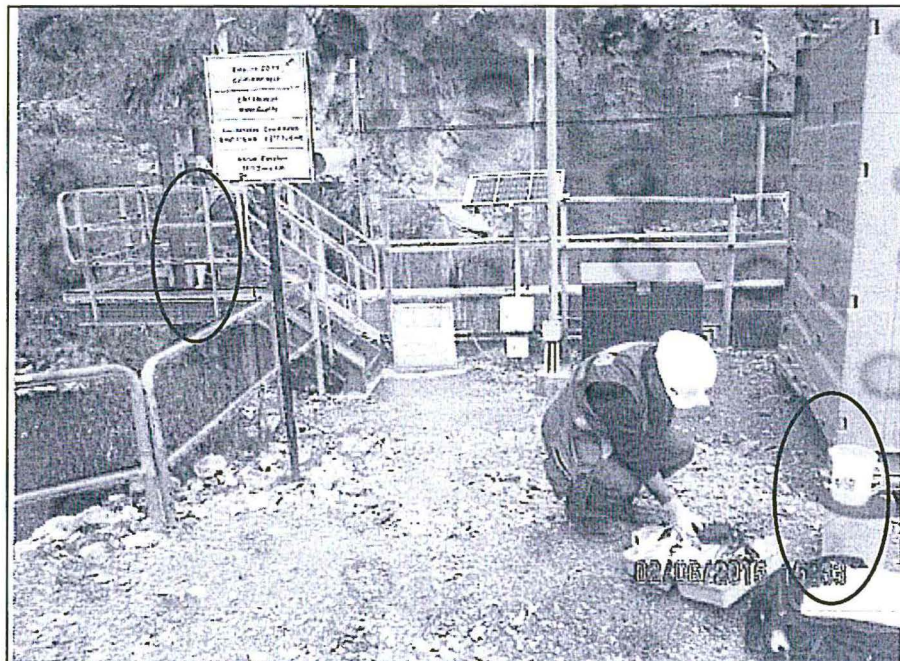
Fotografía N° 14: Medición de los parámetros de campo pH y temperatura en el punto de muestreo 64,1,CO-13.