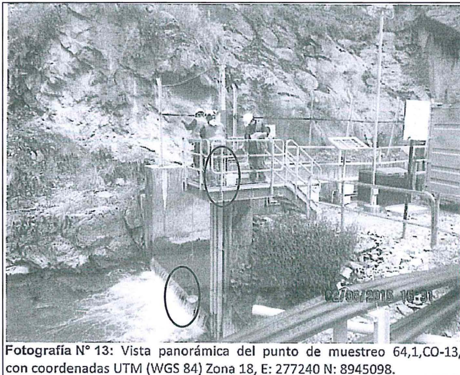
Fotografía N° 13: Vista panorámica del punto de muestreo 64,1,CO-13, con coordenadas UTM (WGS 84) Zona 18, E: 277240 N: 8945098.