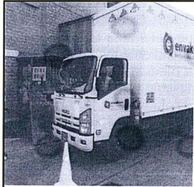
FOTO N°08: La empresa prestadora del servicio de evacuación de residuos sólidos peligros en plena labor.