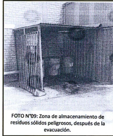
FOTO N°09: Zona de almacenamiento de residuos sólidos peligrosos, después de la evacuación.