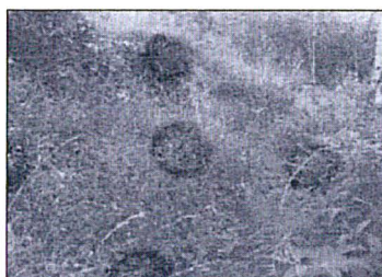
Torre N° 03