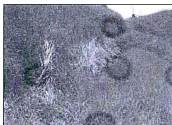
Torre N° 02