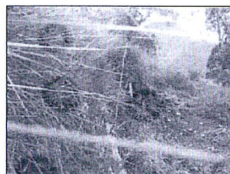
Torre N° 04