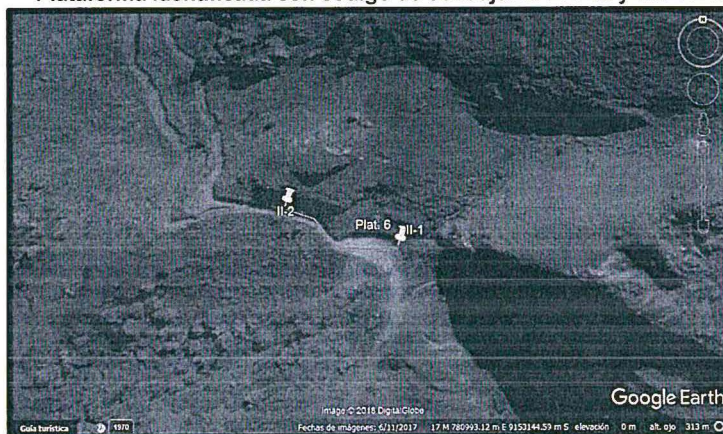
Plataforma identificada con código de sondaje: CA-07-02 y CA-12-18