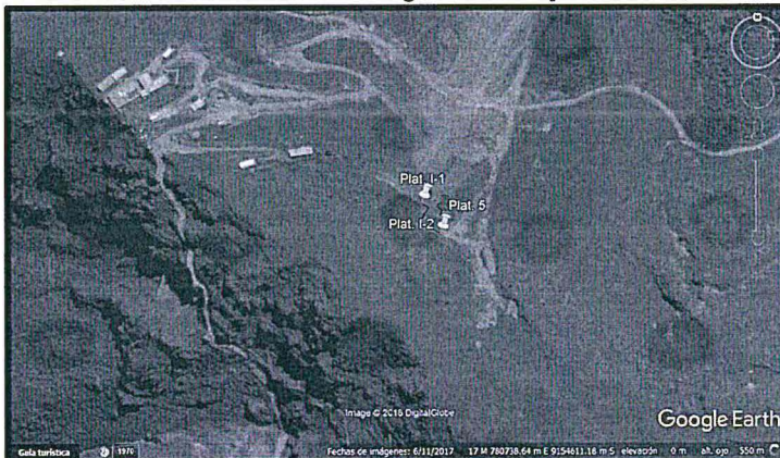
Plataforma identificada con código de sondaje: CA-11-12 y CA-11-15