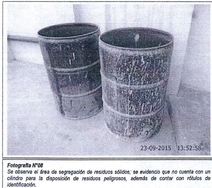
Imagen N° 1: Anexo 7 Panel fotográfico