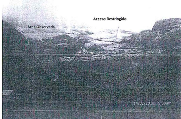
Fotografía N° 5. Vista panorámica del área observada en la Desmontera Mariana (Coordenadas UTM WGS84 788 909 E, 8 342 665 N)