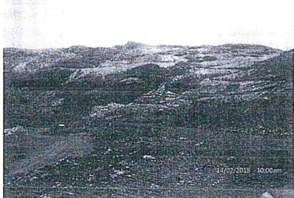
Fotografía N° 6. Vista del área observada en la Desmontera Mariana (Coordenadas UTM WGS84 789 352 E, 8 342 855 N).