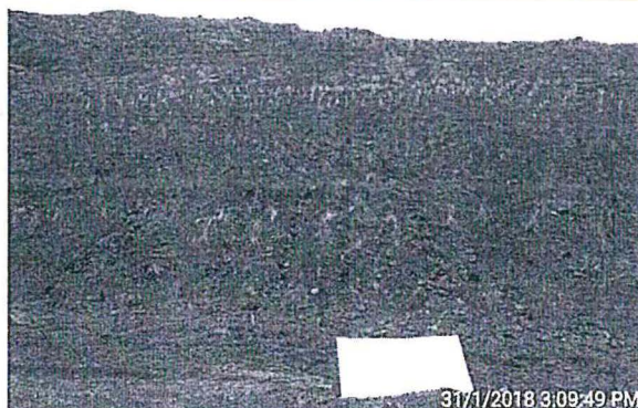
Fotografía N° 4. Zona rocosa sin revegetación en el talud superior de la Desmontera Mariana (Coordenadas UTM WGS84 789 439E, 8 343 171N)