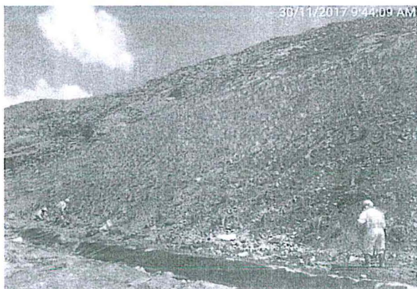
Fotografía N° 1. Revegetación en el talud superior de la Desmontera Mariana (Coordenadas UTM WGS84 WGS84 789 452E, 8 343 164N). Fuente: Primer y segundo escrito de descargos