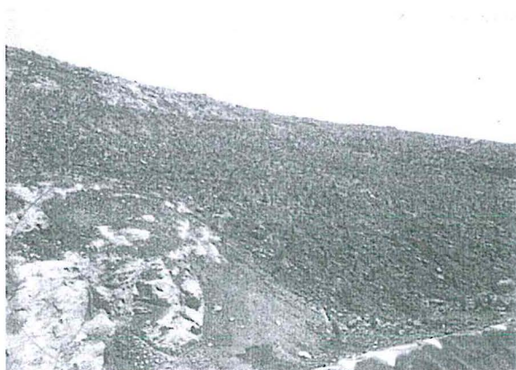
Fotografía N° 2. Revegetación en el talud superior de la Desmontera Mariana (Coordenadas UTM WGS84 789 452E, 8 343 164N).