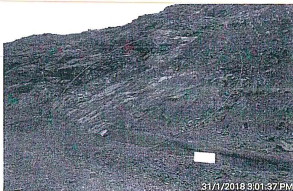
Fotografía N° 3. Zona rocosa sin revegetación en el talud superior de la Desmontera Mariana (Coordenadas UTM WGS84 789 436 E, 8 343 181 N).