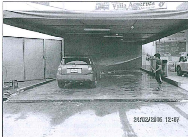
Imagen N°2: Fotografías del área de lavado detectado durante la Acción de Supervisión N° 2