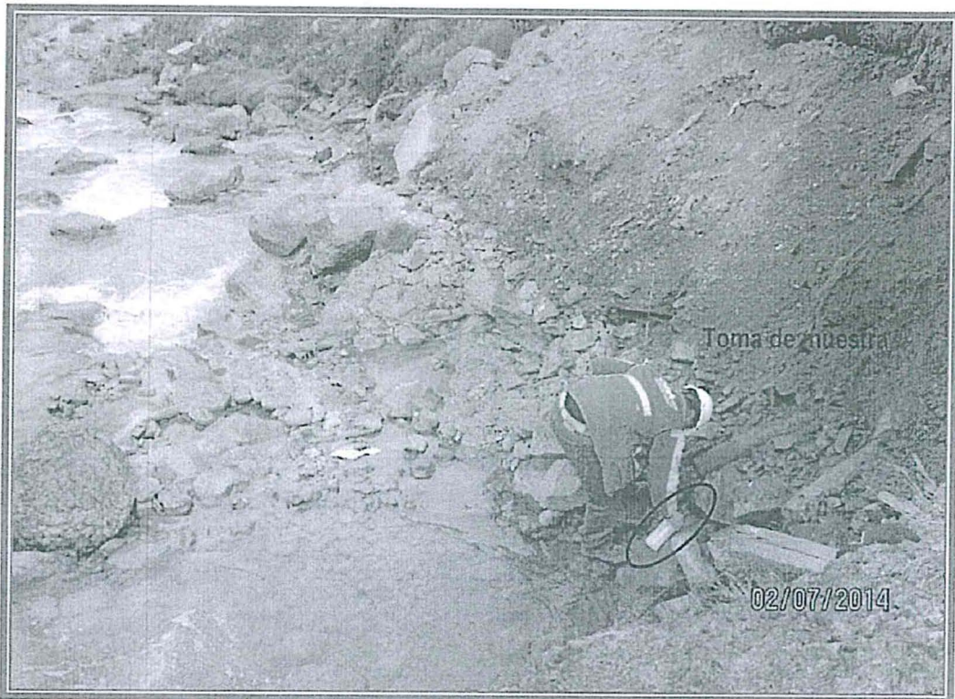
Fotografía N° 7: Punto de monitoreo 407, 1, ESP-3: Personal del OEFA tomando muestra de agua, Ubicado a 5 metros aguas arriba del canal de coronación del depósito remediado de Casapalca. Coordenadas del lugar UTM (Datum WGS 84) E 364884, N 8711398.