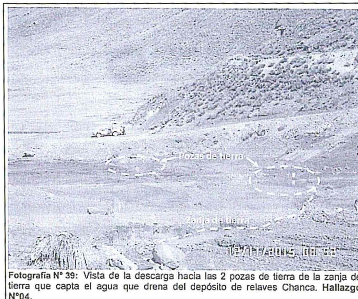
Fotografía N° 39: Vista de la descarga hacia las 2 pozas de tierra de la zanja de tierra que capta el agua que drena del depósito de relaves Chanca. Hallazgo N°04.