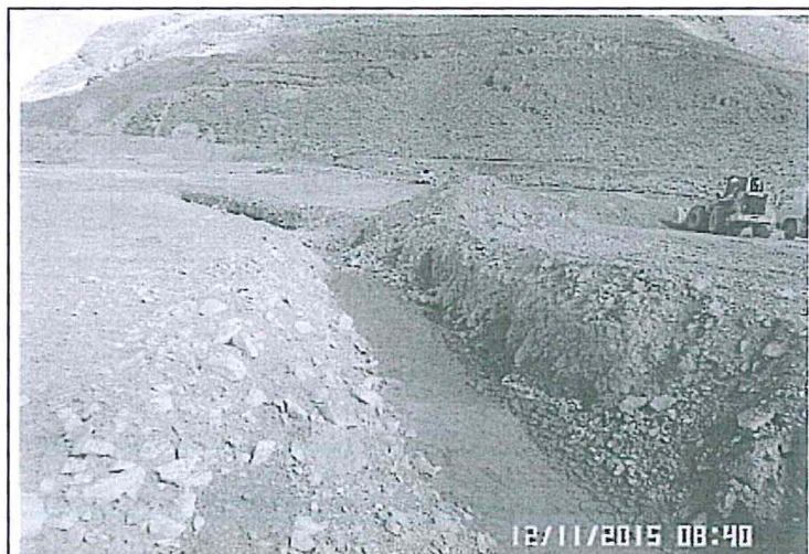
Fotografía N° 37: Vista de la zanja de tierra que capta el agua que drena del depósito de relaves Chanca, coordenadas UTM WGS84 8831881N, 293909E. Hallazgo N°04.

51. La Dirección de Supervisión señala que se advirtió la existencia de dos pozas de tierra por donde eran conducidas las aguas de drenaje del Depósito de Relaves Chanca para posteriormente ser descargadas a la Quebrada Chanquillo. Lo constatado por la Dirección de Supervisión se sustenta en las fotografías N° 37 a 39 del Informe de Supervisión, las cuales se observan a continuación: