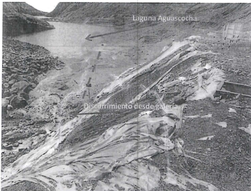
Fotografía N° 007: Vista fotográfica de la laguna superior Aguascocha y el discurriramiento desde la galería nivel 4540.