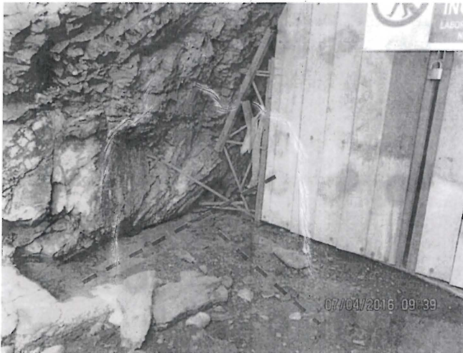
Fotografía N° 004: Nótese que parte del efluente era conducido mediante un canal de concreto y una tubería HDPE hacia la poza de sedimentación y la otra parte discurría por la vía de acceso hasta llegar a la laguna superior Aguascocha.