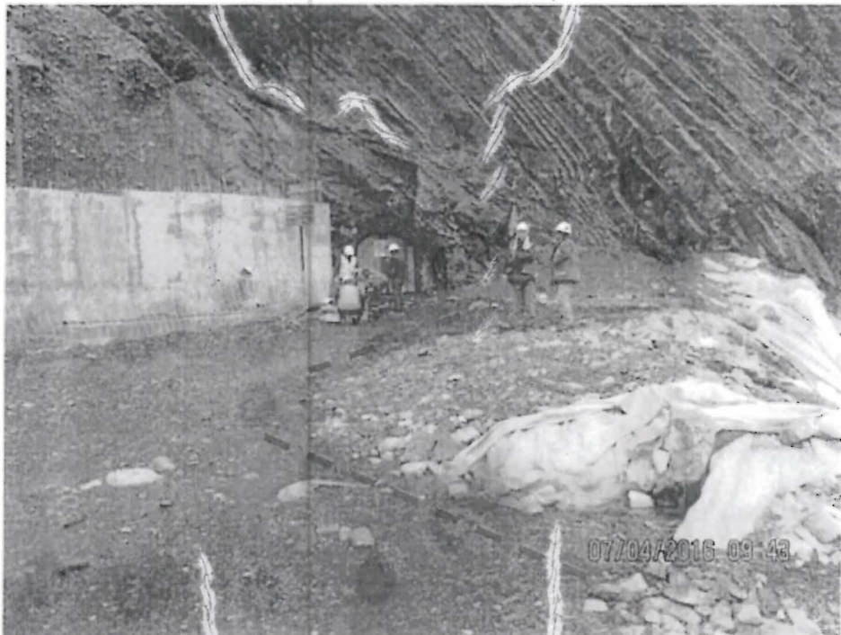
Fotografía N° 006: Nótese que parte del efluente discurría por la vía de acceso hasta llegar a la laguna superior Aguascocha.