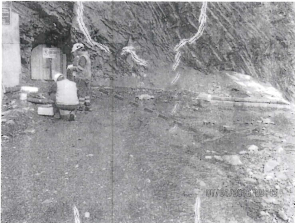
Fotografía N° 005: Nótese que parte del efluente discurría por la vía de acceso hasta llegar a la laguna superior Aguascocha.