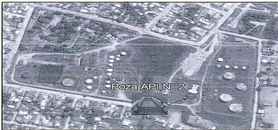
Elaboración: Dirección de Fiscalización y Aplicación de Incentivos – DFAI.